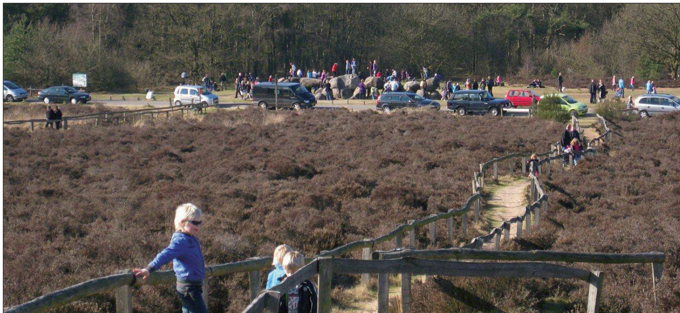
Recreatiedrukte Hunebedden Havelte