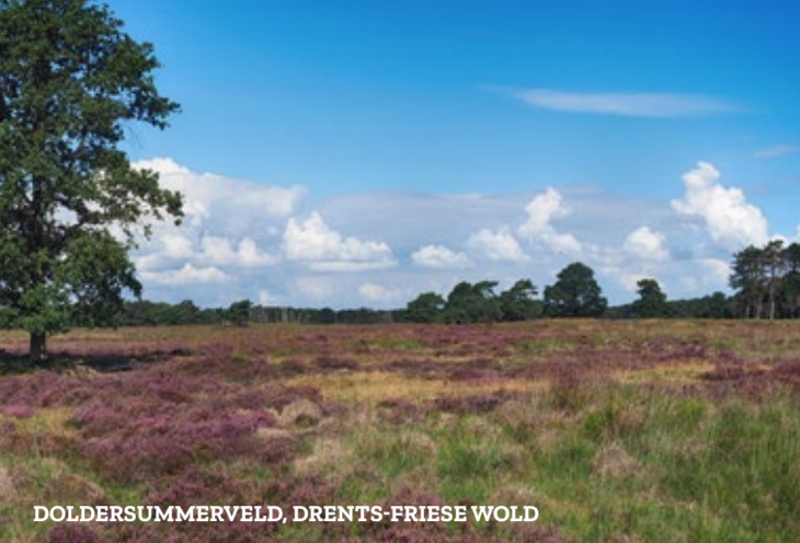
DOLDERSUMMERSVELD, DRENTS-FRIESE WOLD