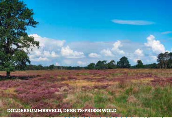
DOLDERSUMMERVELD, DRENTS-FRIESE WOLD